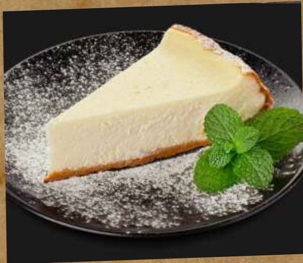
ЧИЗКЕЙК CHEESECAKE 起司蛋糕