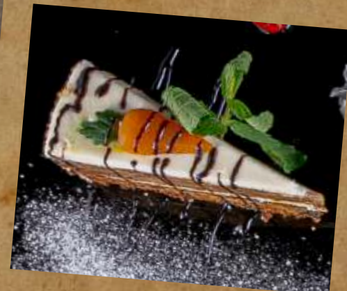
МОРКОВНЫЙ ТОРТ CARROT CAKE 胡萝卜蛋糕