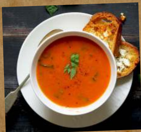
ТОМАТНЫЙ СУП TOMATO SOUP 蕃茄汤