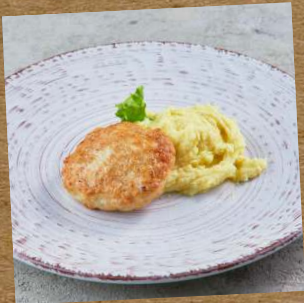
КУРИНЫЕ КОТЛЕТКИ CHICKEN RISSOLES 鸡排