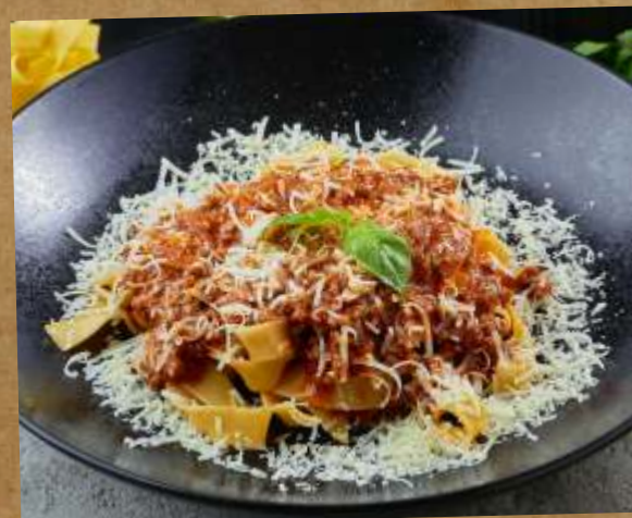
БОЛОНЬЕЗЕ ФЕТУЧИНИ FETTUCCINE BOLOGNAISE 意大利肉酱面