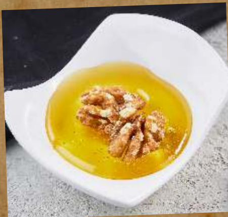
МЕД ЦВЕТОЧНЫЙ FLOWER HONEY 蜜糖