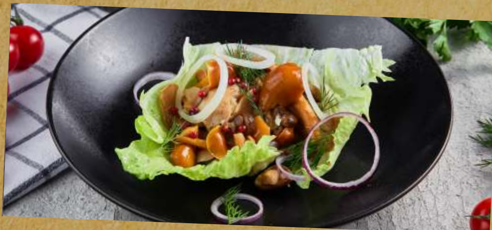
СОЛЕННЫЕ ГРИБОЧКИ PICKLED MUSHROOMS 咸蘑菇