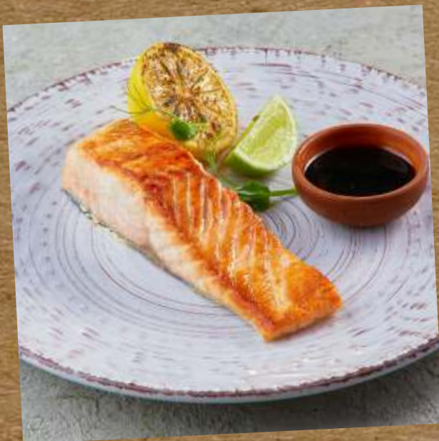
СТЕЙК ИЗ ФОРЕЛИ НА ГРИЛЕ / ФОРЕЛЬ НА ПАРУ GRILLED TROUT STEAK / STEAMED TROUT 狗头鱼 / 炙鱼