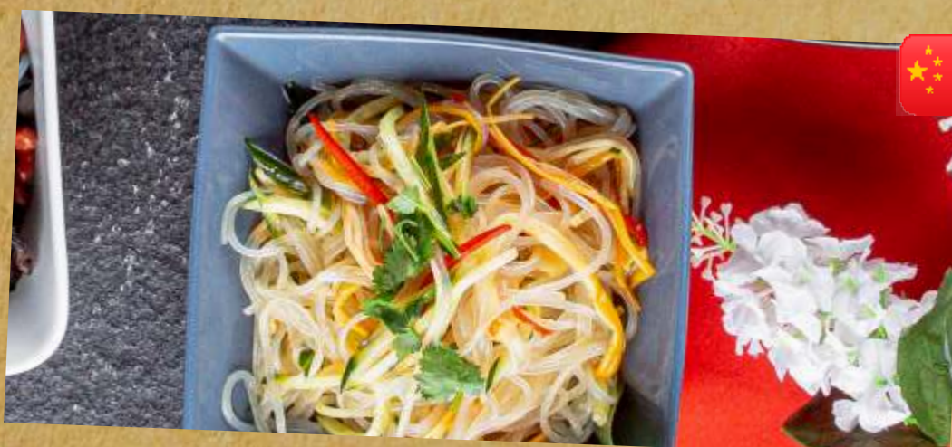
"ЗОЛОТЫЕ НИТИ" С ФУНЧОЗОЙ SALAD WITH GLASS NOODLE AND "GOLDEN THREADS" 凉拌三丝