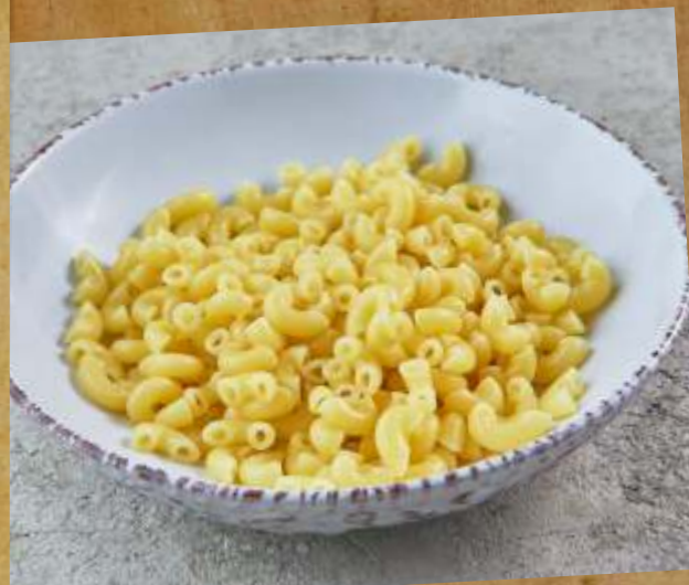
МАКАРОНЫ / КАРТОФЕЛЬ ФРИ / КАРТОФЕЛЬНОЕ ПЮРЕ / РИС ОТВАРНОЙ MACARONI / FRENCH FRIES / MASHED POTATOES / BOILED RICE 意大利面/炸薯条/土豆泥/白饭