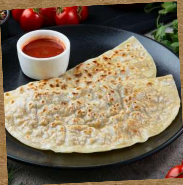
КУТАБЫ С ЯГНЕНКОМ KUTABS WITH LAMB 羊肉薄饼