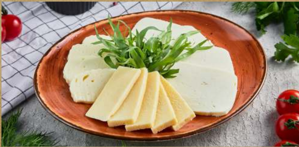
АССОРТИ ВОСТОЧНЫХ СЫРОВ ORIENTAL CHEESE PLATE 各种东方奶酪