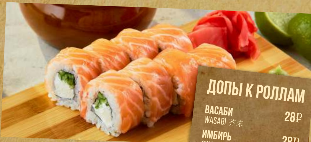
ФИЛАДЕЛЬФИЯ PHILADELPHIA ROLL 費城卷