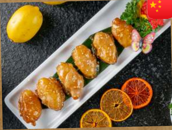
БАНАНЫ В КАРАМЕЛИ CARAMEL BANANAS 拔丝香蕉