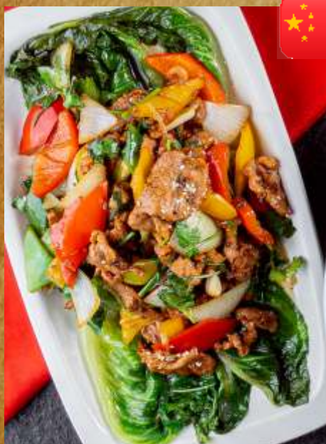
ЖАРЕНАЯ БАРАНИНА С ОВОЩАМИ FRIED LAMB WITH VEGETABLES 时蔬孜然羊肉