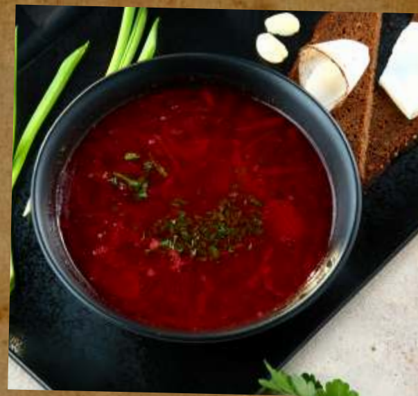
БОРЩ С ФЕРМЕРСКОЙ ГОВЯДИНОЙ «BORSCH» BEETROOT SOUP WITH FARM BEEF 热小牛肉罗宋汤