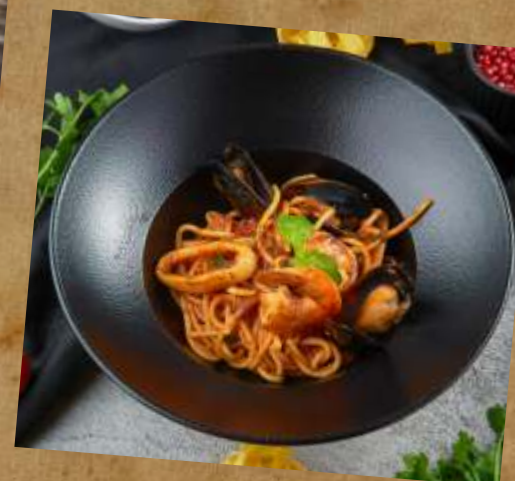
С МОРЕПРОДУКТАМИ СПАГЕТТИ SPAGHETTI WITH SEAFOOD 海鲜意大利面