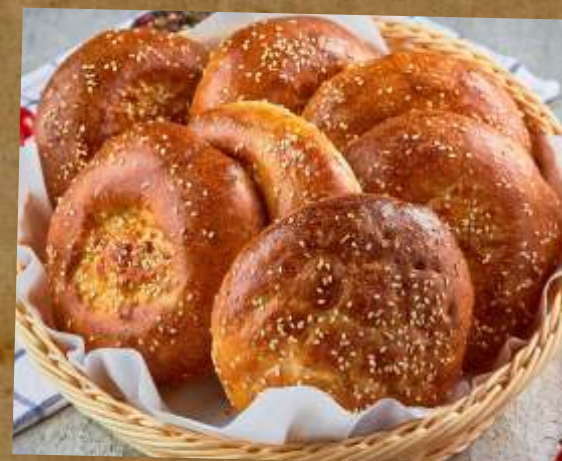
ЛЕПЕШКА JOHNNY-CAKE 东方烤饼