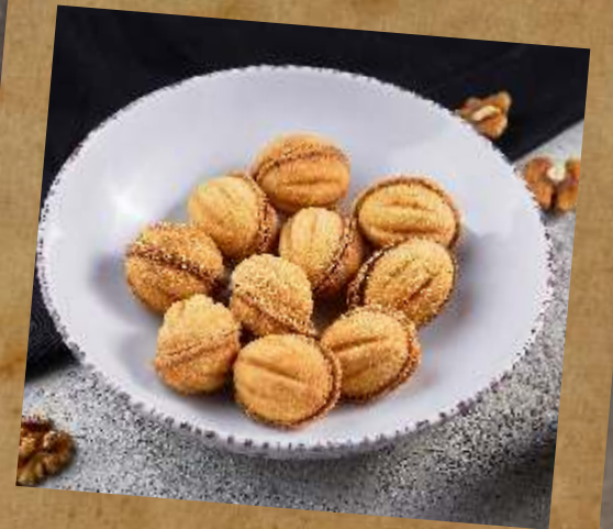
ДОМАШНИЕ ОРЕШКИ СО СГУЩЕНКОЙ HOME MADE NUTS WITH CONDENSED MILK 浓缩坚果