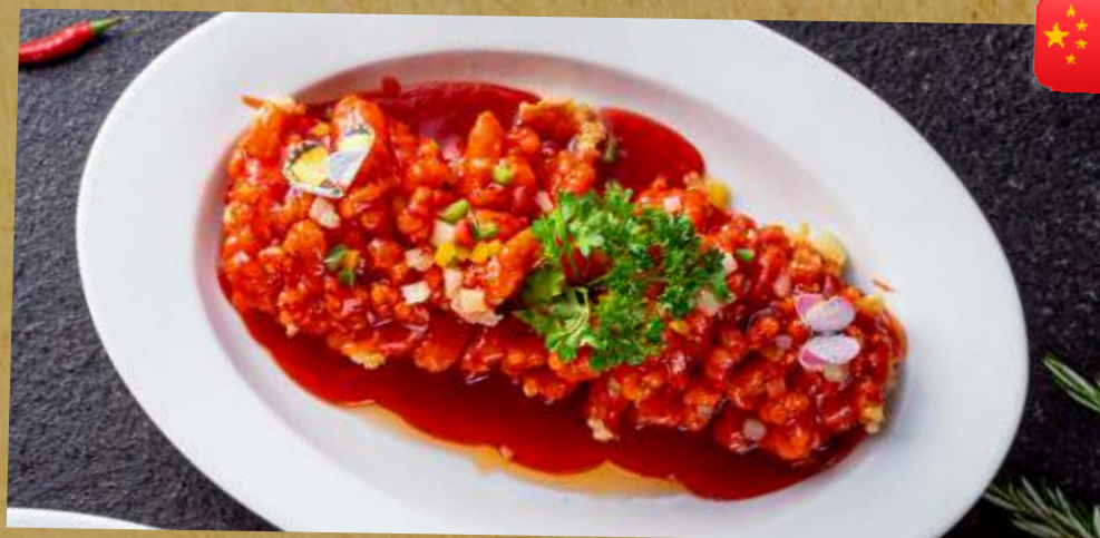
СУДАК "ЁЛОЧКА" В КИСЛО-СЛАДКОМ СОУСЕ HERRINGBONE SALMON IN SWEET AND SOUR SAUCE 松鼠苏达克