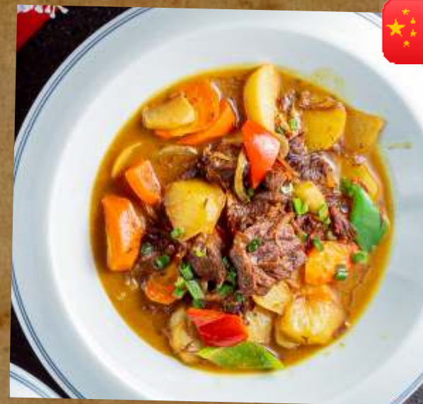
ГОВЯДИНА В СОУСЕ КАРРИ CURRY BEEF 咖喱牛肉