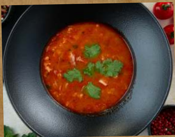
ХАРЧО MEAT SOUP «KHARCHO» 羊肉汤