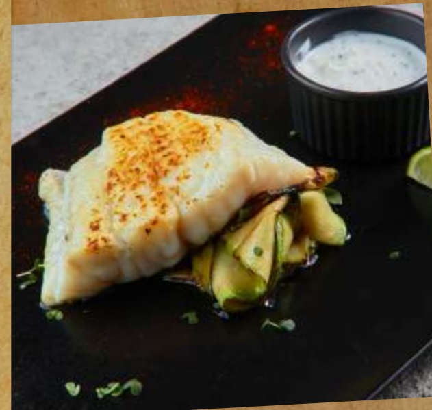
ФИЛЕ СУДАКА НА ПОДУШКЕ ИЗ КАБАЧКОВ ZANDER FILLET ON MARROWS PILLOW 用西葫芦煮的桑德鱼片