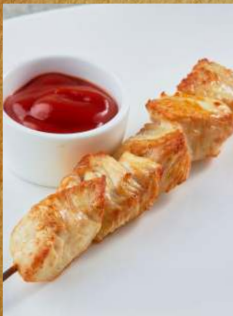
ШАШЛЫЧКИ ИЗ КУРОЧКИ CHICKEN SMALL SHASHLIKS 鸡肉串