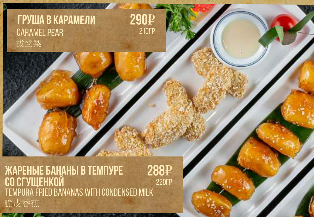
ГРУША В КАРАМЕЛИ CAMEL PEAR 拔丝梨