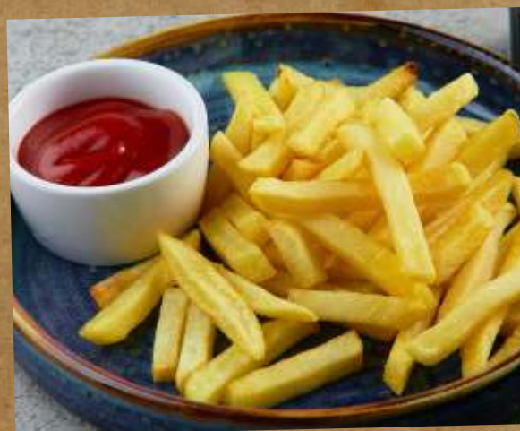
КАРТОФЕЛЬ ФРИ / АЙДАХО FRENCH FRIES / IDAHO POTATOES 炸薯條