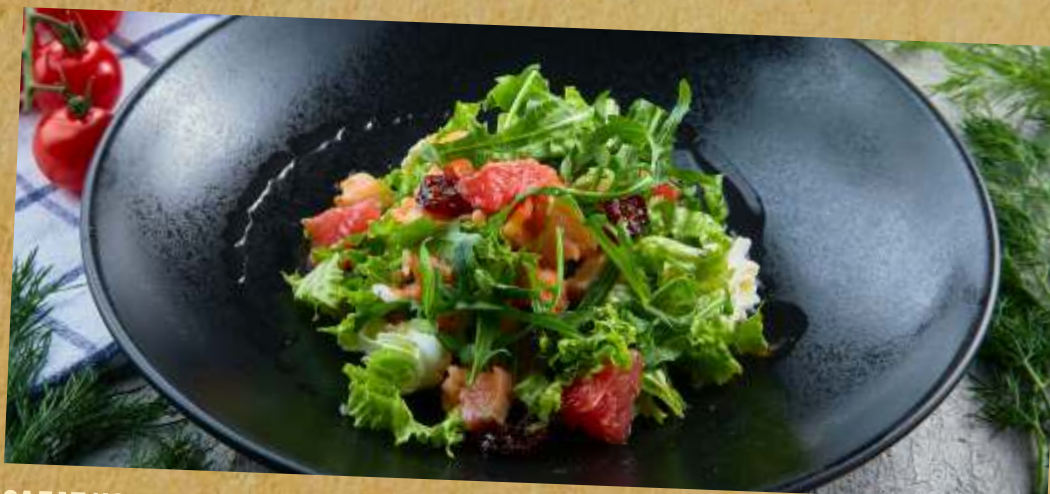
САЛАТ ИЗ ПЕЧЕНЫХ ТОМАТОВ С ЛОСОСЕМ ФИРМЕННОГО ПОСОЛА SALAD WITH BAKED TOMATOES AND SALTED SALMON 烤番茄沙拉和鲑鱼