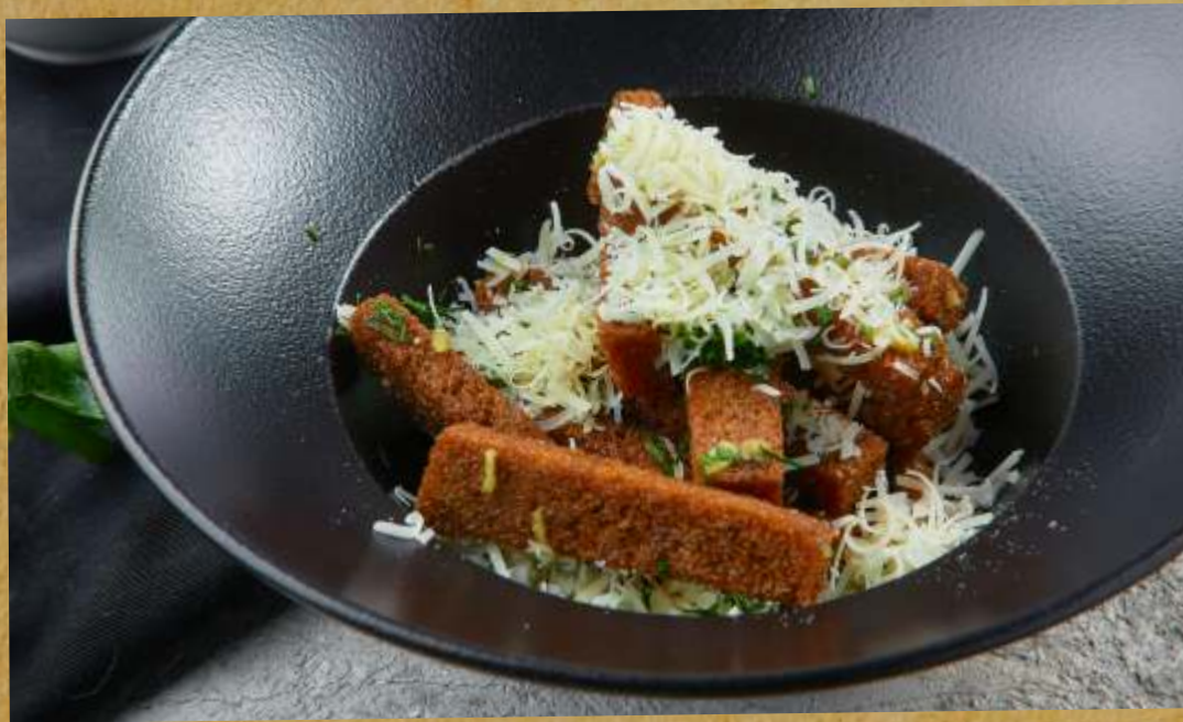
ГРЕНКИ С СЫРОМ / С ЧЕСНОКОМ CROUTONS WITH CHEESE / GARLIC 蒜蓉法棒