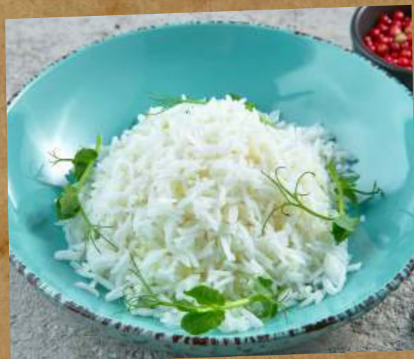
РИС ОТВАРНОЙ BOILED RICE 白飯