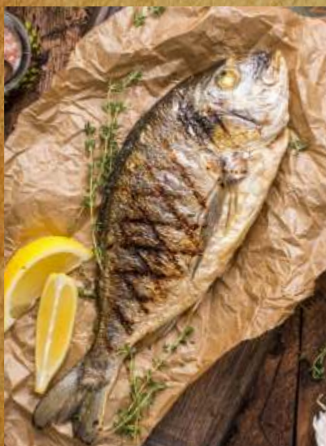
ДОРАДА НА ГРИЛЕ GRILLED DORADA 烤多拉達