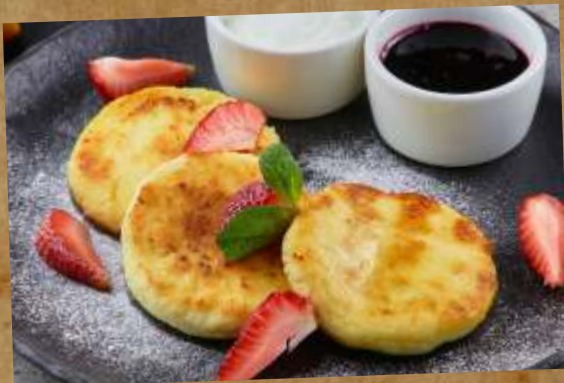
СЫРНИКИ ИЗ ТВОРОГА С ДОМАШНИМ ВАРЕНЬЕМ COTTAGE CHEESE PANCAKES WITH HOME MADE JAM 果酱奶酪煎饼