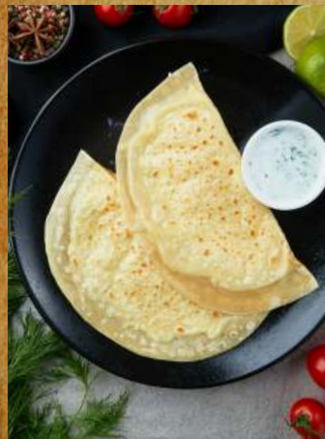
КУТАБЫ С СЫРОМ KUTABS WITH CHEESE 芝士薄饼