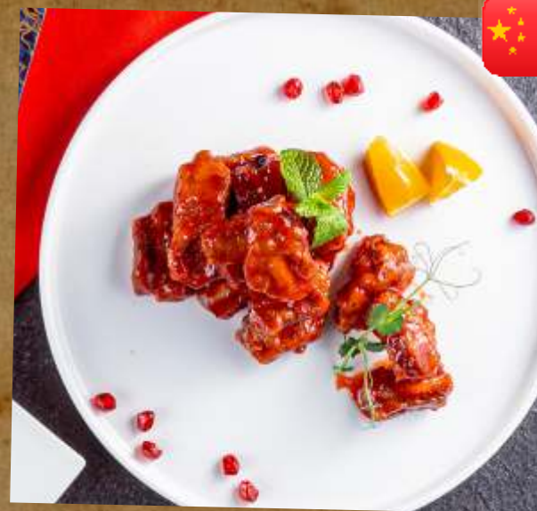
СВИНЫЕ РЕБРЫШКИ В МАНГОВОМ СОУСЕ PORK BABY RIBS IN MANGO SAUCE 芒果醬排骨