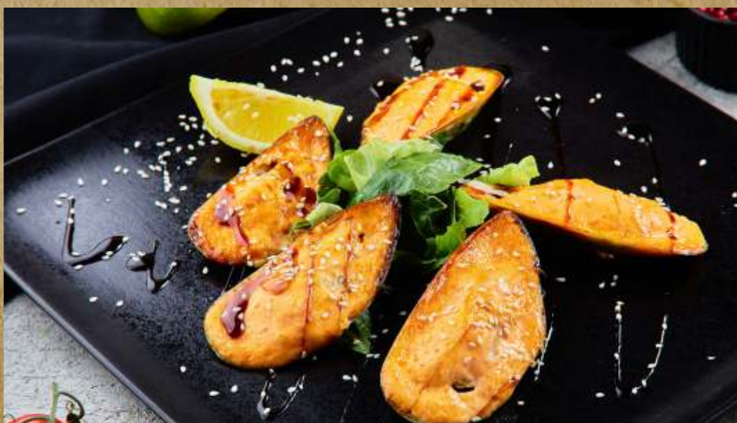
ЗАПЕЧЕННЫЕ МИДИИ BAKED MUSSELS 贻贝