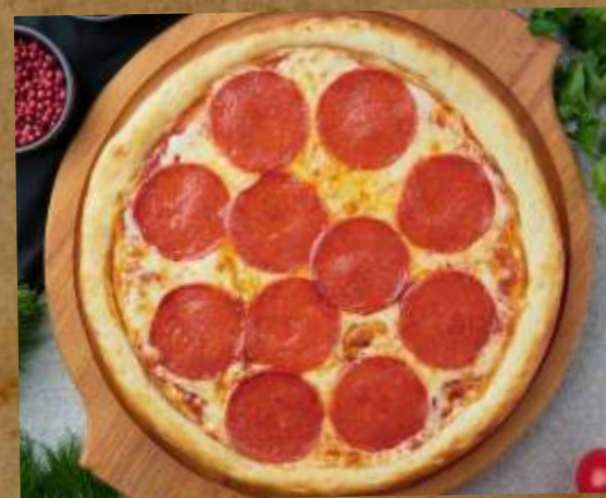
ПИЦЦА ПЕППЕРОНИ PIZZA PEPPERONI 佩佩罗尼披萨