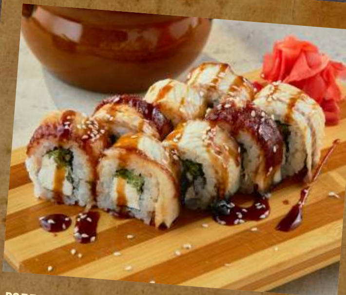
РОЛЛ С УГРЕМ ROLL WITH EEL 鰻魚壽司