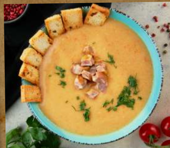
ГОРОХОВЫЙ С КОПЧЕНОСТЯМИ PEA SOUP WITH SMOKED MEAT 豌豆汤