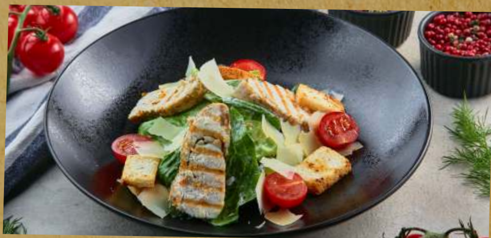
ЦЕЗАРЬ С КУРИЦЕЙ / КРЕВЕТКАМИ CAESAR SALAD WITH CHICKEN / PRAWNS 虾凯撒沙拉 / 凯撒沙拉拌虾