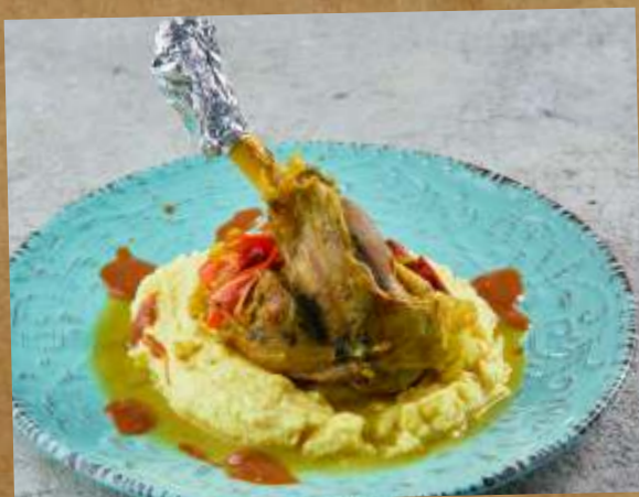
ЗАПЕЧЕННАЯ РУЛЬКА ЯГНЕНКА С ОВОЩАМИ И ПЕЧЕНЫМ КАРТОФЕЛЕМ 498₽ 200/200ГР BAKED LAMB KNUCKLE WITH VEGETABLES AND BAKED POTATOES 蔬菜和土豆烤羊腿