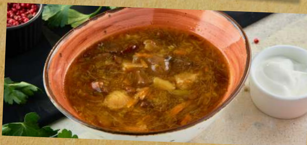
ГРИБНОЙ СУП MUSHROOM SOUP 蘑菇汤