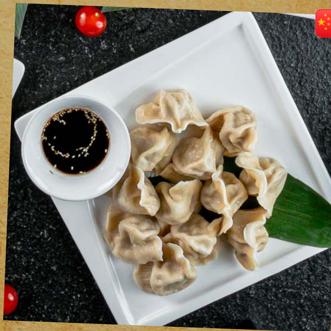
ВАРЕННЫЕ ПЕЛЬМЕНИ С БАРАНИНОЙ BOILED DUMPLINGS WITH LAMB 羊肉煮的饺子