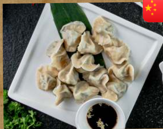
ВАРЕННЫЕ ПЕЛЬМЕНИ С ОВОЩАМИ 288₽ BOILED DUMPLINGS WITH VEGETABLES 320ГР 三鲜水饺