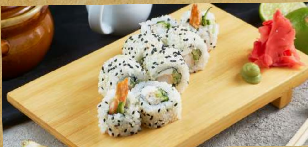
СЛИВОЧНЫЙ РОЛЛ С КРЕВЕТКОЙ CREAM ROLL WITH PRAWN 奶油蝦壽司