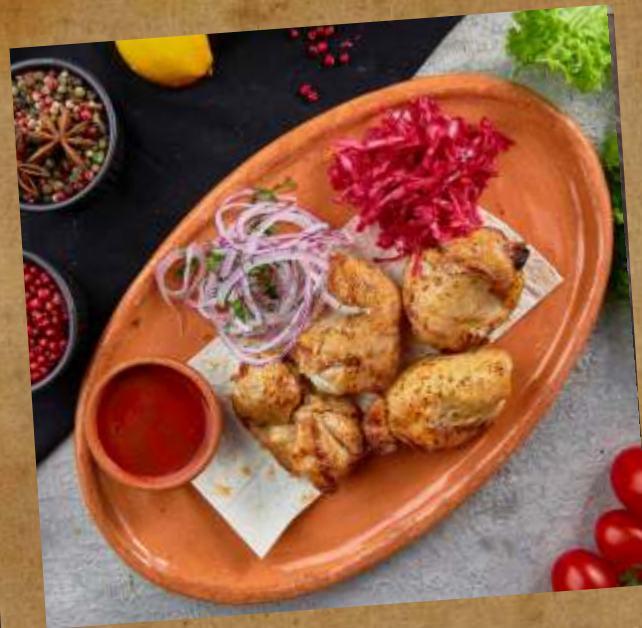
ШАШЛЫК ИЗ КУРЫ CHICKEN SHASHLYK 烤鸡肉