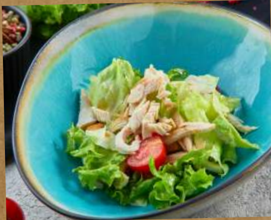
ОЛИВЬЕ / КРАБИК / САЛАТ С ЦЫПЛЕНКОМ OLIVIER (SALAD WITH MEAT) / SALAD WITH CRAB / SALAD WITH CHICKEN 沙拉沙拉/蟹沙拉/鸡肉沙拉