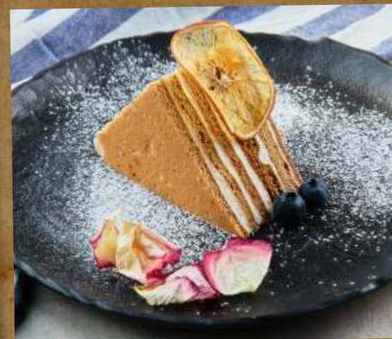
МЕДОВИК HONEY CAKE 胡萝卜蛋糕