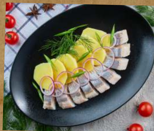
СЕЛЬДЬ ПРЯНАЯ С КАРТОФЕЛЕМ И ЛУКОМ PIQUANT HERRING WITH POTATO AND ONION 鲱鱼