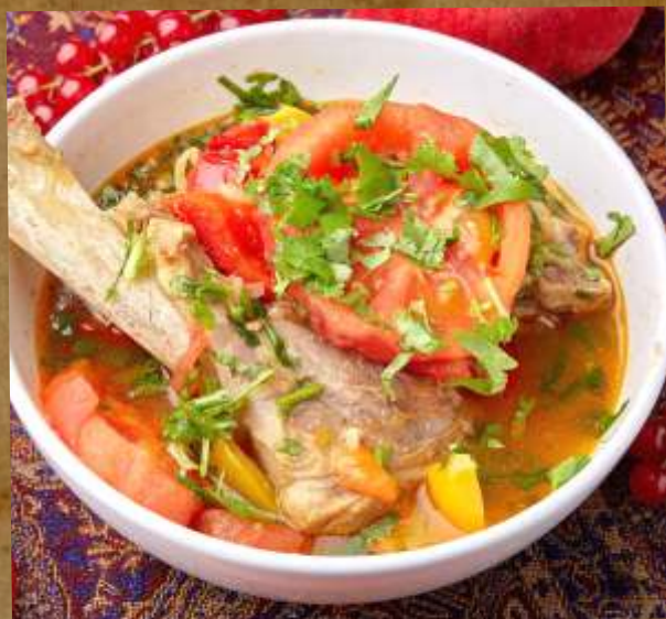
БОЗАРТМА ИЗ БАРАНИНЫ BOSARTMA OF MUTTON 羊肉的