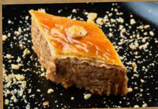
ПАХЛАВА БАКИНСКАЯ С ГРЕЦКИМИ ОРЕХАМИ И ФУНДУКОМ BAKU PAKHLAVA WITH WALNUTS AND HAZELNUTS 东方甜味