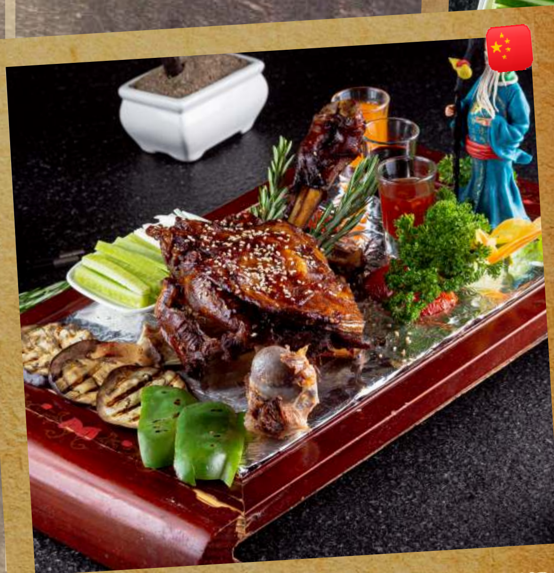
КОПЧЕНАЯ БАРАНЬЯ НОГА С ОВОЩАМИ SMOKED MUTTON WITH VEGETABLES 秦王碳烤羊腿