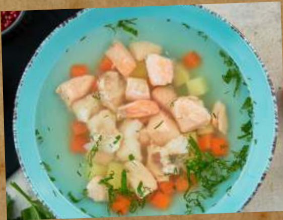
УХА «УКНА» FISH SOUP 鱼汤