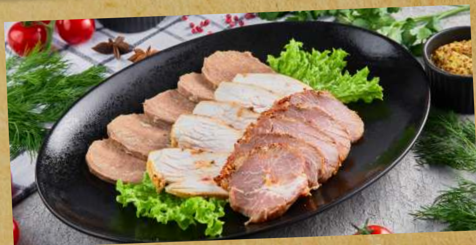
МЯСНОЕ АССОРТИ MEAT PLATE 什锦肉拼盘