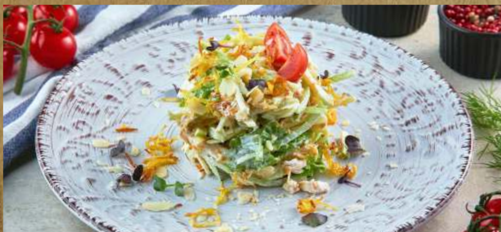
САЛАТ ИЗ НЕЖНОЙ ГРУДКИ ЦЫПЛЕНКА SALAD WITH TENDER CHICKEN BREAST 鸡肉沙拉