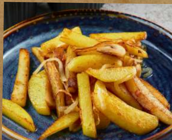
ЖАРЕННЫЙ КАРТОФЕЛЬ С ГРИБАМИ И ЛУКОМ FRIED POTATOES WITH MUSHROOMS AND ONIONS 炸土豆和蘑菇和洋葱