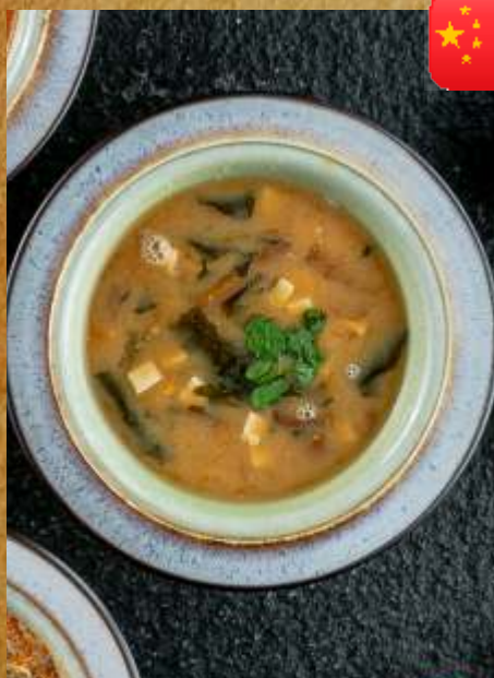
МИСО-СУП MISO SOUP 日本大酱汤