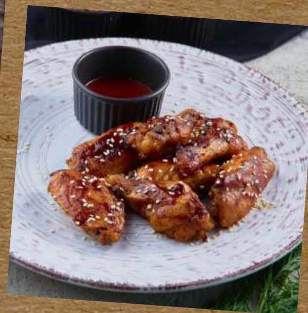
КУРИНЫЕ КРЫЛЬЯ ВВQ CHICKEN WINGS BBQ 鸡翅烧烤