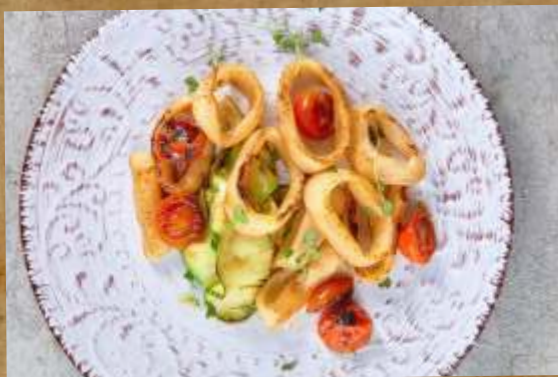
ФИЛЕ КАЛЬМАРА НА ГРИЛЕ GRILLED SQUID FILLET 烤魷魚