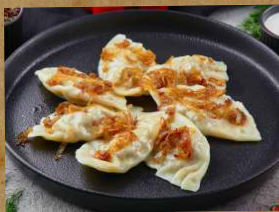
ВАРЕНИКИ С КАРТОФЕЛЕМ, ГРИБАМИ И ШКВАРКАМИ DUMPLINGS WITH POTATOES, MUSHROOMS AND CRACKLINGS 土豆和蘑菇餃子