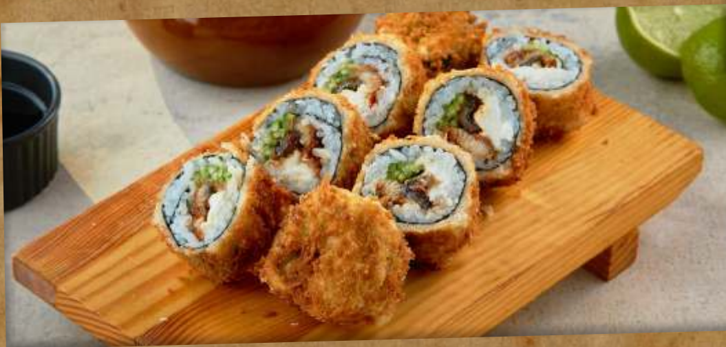
ТЕПЛЫЙ РОЛЛ С УГРЕМ BAKED ROLL WITH EEL 烤鰻魚壽司