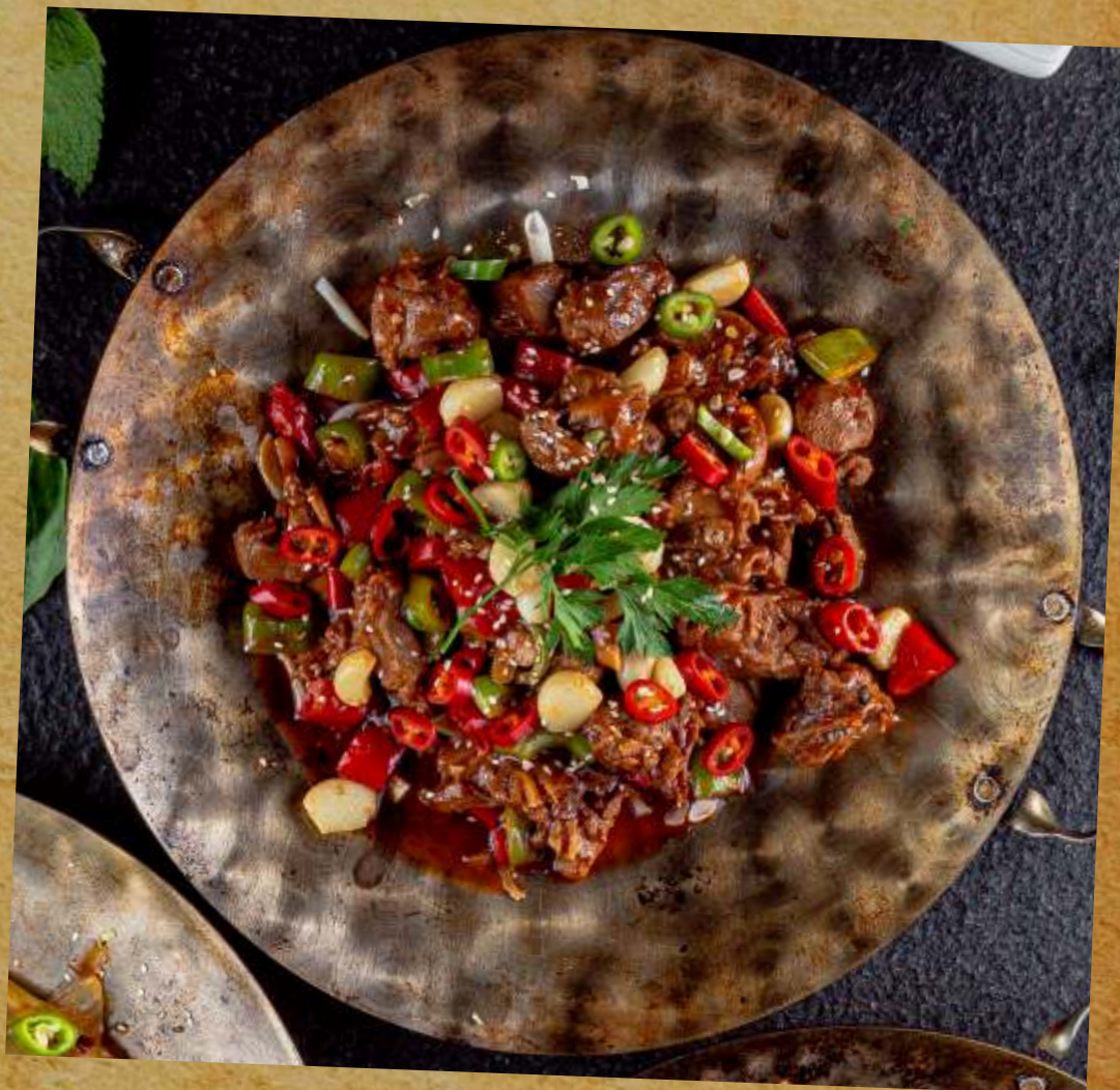
КИТАЙСКИЙ САДЖ С УТКОЙ В ОСТРОМ МАСЛЕ CHINESE SAGE WITH DUCK IN SPICY BUTTER 干锅啤酒鸭