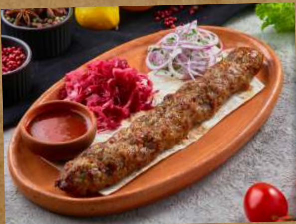
ЛЮЛЯ КЕБАБ ИЗ ЯГНЕНКА LAMB LYULYA KEBAB 羊杂