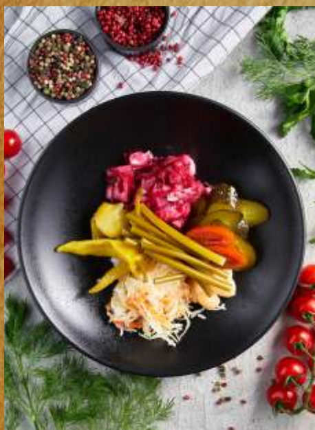
ДОМАШНИЕ И БОЧКОВЫЕ СОЛЕНЬЯ HOME MADE AND BARREL PICKLES 泡菜