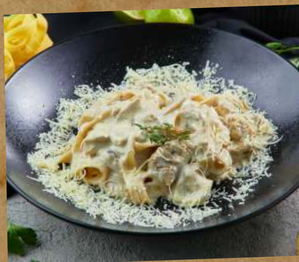
С БЕЛЫМИ ГРИБАМИ ФЕТУЧИНИ FETTUCCINE WITH CER MUSHROOMS 蘑菇意面