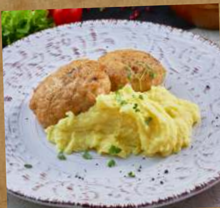
КОТЛЕТЫ КУРИНЫЕ / МЯСНЫЕ С ПЕЧЕНЫМ КАРТОФЕЛЕМ RISOLES: CHICKEN / MEAT / ZANDER WITH BAKED POTATO 鸡排/肉排/派克鲈鱼肉饼