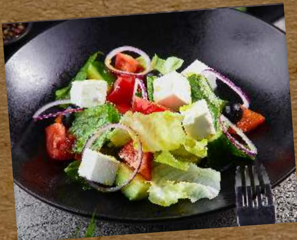
ГРЕЧЕСКИЙ GREEK SALAD 希腊沙拉