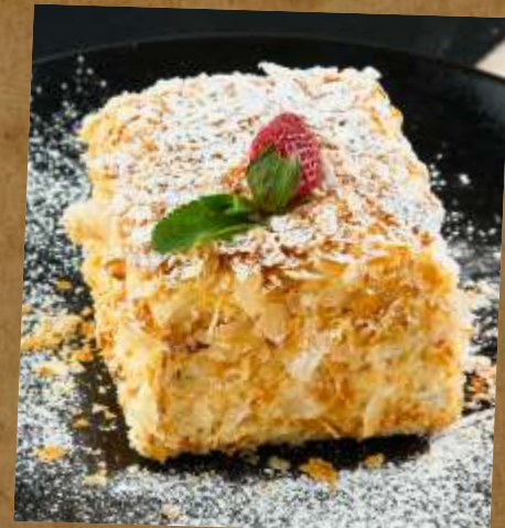
НАПОЛЕОН NAPOLEON 拿破仑蛋糕