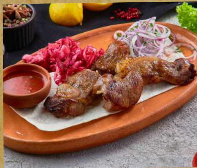
ШАШЛЫК ИЗ МЯКОТИ ЯГНЕНКА LAMB MEAT SHASHLYK 羊肉串