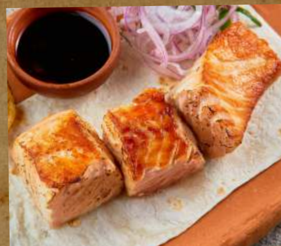
ШАШЛЫК ИЗ ФОРЕЛИ TROUT SHASHLIK 三文鱼烤串