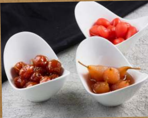
ВАРЕНЬЕ В АССОРТИМЕНТЕ JAM ASSORTED 果酱