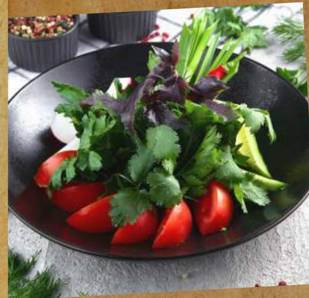
СВЕЖИЕ ОВОЩИ С ЗЕЛЕНЬЮ FRESH VEGETABLES WITH GREENS 新鲜绿色蔬菜