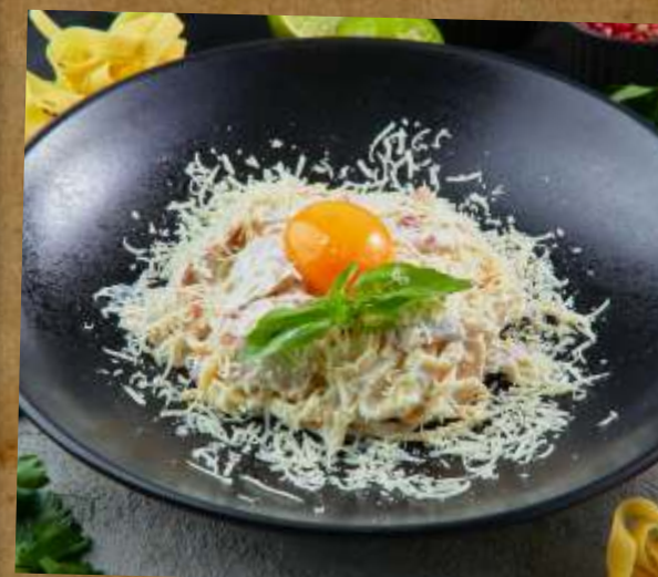
КАРБОНАРА СПАГЕТТИ SPAGHETTI «CARBONARA» 芝士培根意大利面