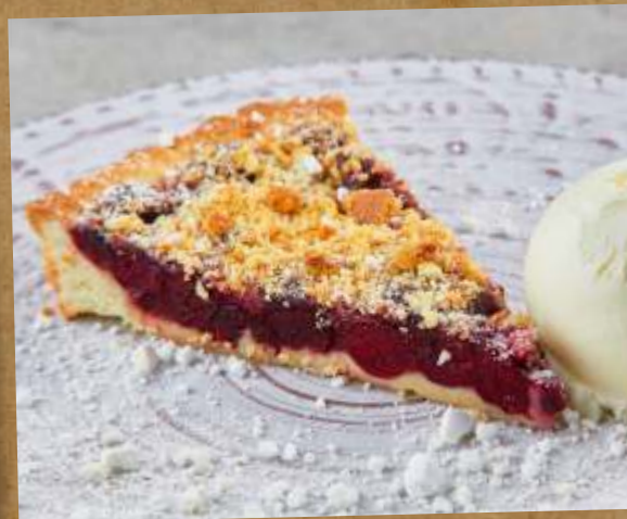
ВИШНЕВЫЙ ПИРОГ CHERRY PIE 樱桃派