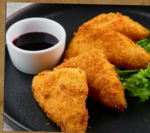
ЖАРЕННЫЙ СУЛУГУНИ FRIED SULUGUNI CHEESE 炸苏丹面奶酪