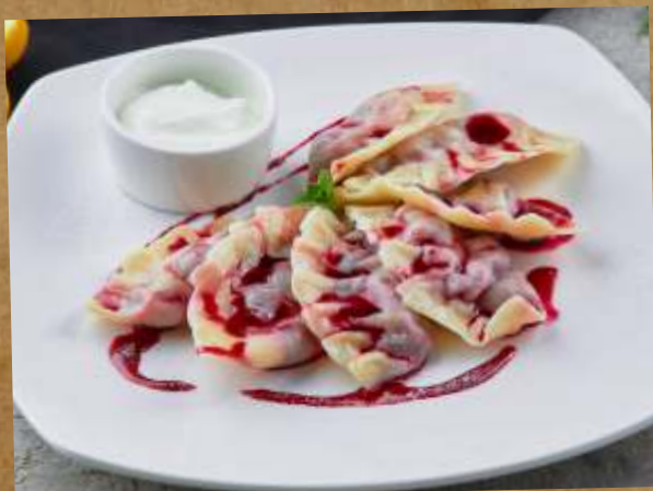
ВАРЕНИКИ С ВИШНЕЙ DUMPLINGS WITH CHERRY 櫻桃餃子