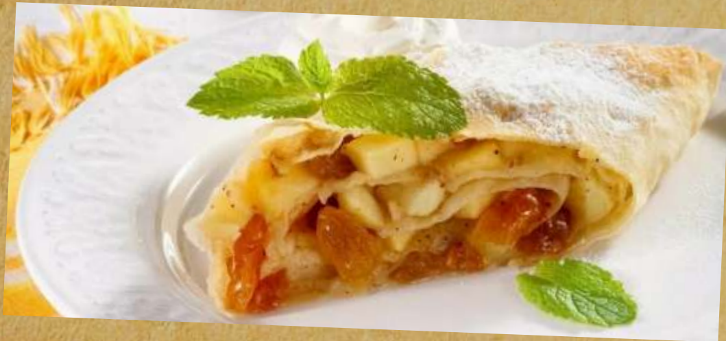
ШТРУДЕЛЬ ЯБЛОЧНЫЙ APPLE STRUDEL 苹果馅薄酥卷饼