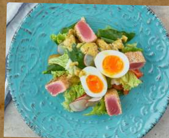
САЛАТ С ТУНЦОМ TUNA SALAD 金枪鱼沙拉