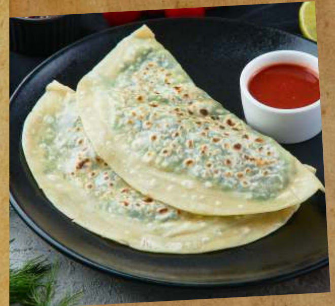
КУТАБЫ С ЗЕЛЕНЬЮ / С СЫРОМ И ЗЕЛЕНЬЮ KUTABS WITH GREENS / WITH CHEESE AND GREENS 青菜薄饼