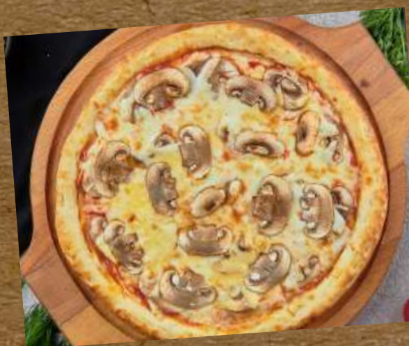
ПИЦЦА С ГРИБАМИ PIZZA WITH MUSHROOMS 蘑菇披萨