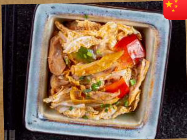
САЛАТ "ЦИНДАО" TSINDAO SALAD 百财手撕鸡