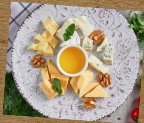
АССОРТИ ЕВРОПЕЙСКИХ СЫРОВ EUROPEAN CHEESE PLATE 各种欧洲奶酪