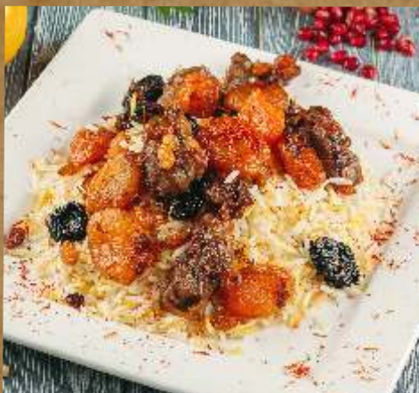
ПЛОВ АЗЕРБАЙДЖАНСКИЙ СВАДЕБНЫЙ PILOT AZERBAIJANI WEDDING 阿塞拜疆抓饭