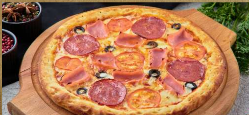
ПИЦЦА СЮПРИМ PIZZA SUPREME 培根披萨