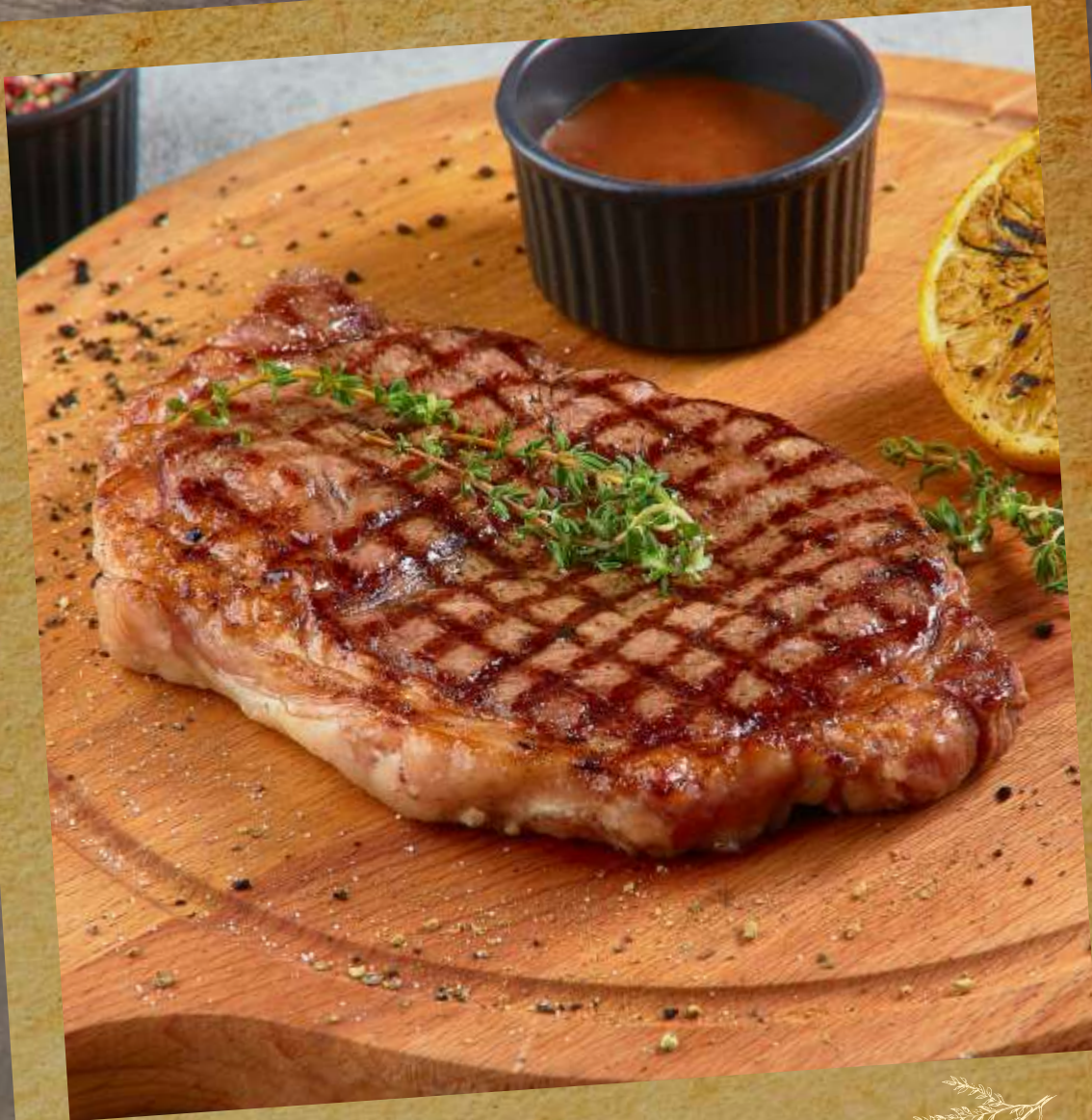
СТРИПЛОЙН STRIPLOIN STEAK 里脊牛排