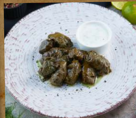
ДОЛМА «DOLMA» STUFFED GRAPE LEAVES ROLL WITH MINCED MEAT WITH RICE 葡萄叶羊肉包饭