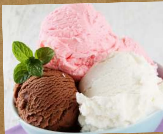
МОРОЖЕНОЕ (ВАНИЛЬНОЕ, КЛУБНИЧНОЕ, ШОКОЛАДНОЕ) ICE CREAM (VANILLA, STRAWBERRY, CHOCOLATE) 冰淇淋 (香草, 草莓, 巧克力)