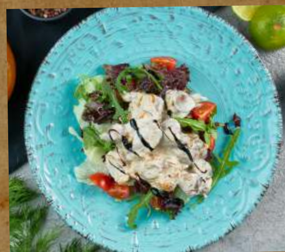
САЛАТ С КУРИНОЙ ПЕЧЕНЬЮ В СЛИВОЧНОМ СОУСЕ SALAD WITH CHICKEN LIVER IN A CREAM SAUCE 奶油酱鸡肝蒸米饭沙拉