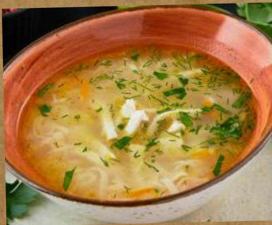
БУЛЬОН С ЦЫПЛЕНКОМ И ДОМАШНЕЙ ЛАПШОЙ CHICKEN BROTH WITH HOME MADE NOODLES 鸡肉面条汤