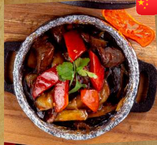
ЖАРЕНАЯ ГОВЯДИНА С БАКЛАЖАНАМИ FRIED BEEF WITH AUBERGINES 铁板茄子烧牛肉