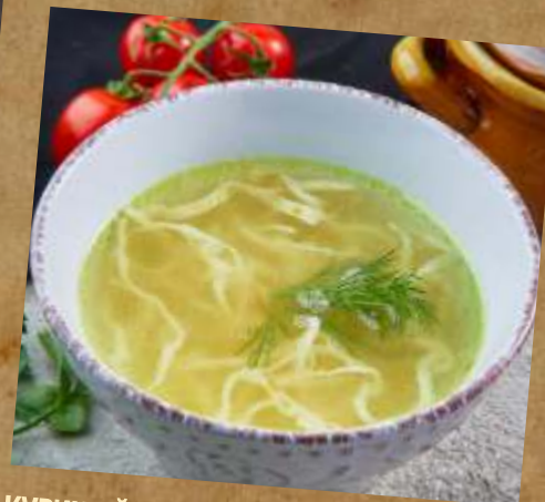
КУРИНЫЙ СУП С ЛАПШОЙ / СУП С ФРИКАДЕЛЬКАМИ АНГЛИЙСКИЙ 鸡肉面条汤/肉丸汤