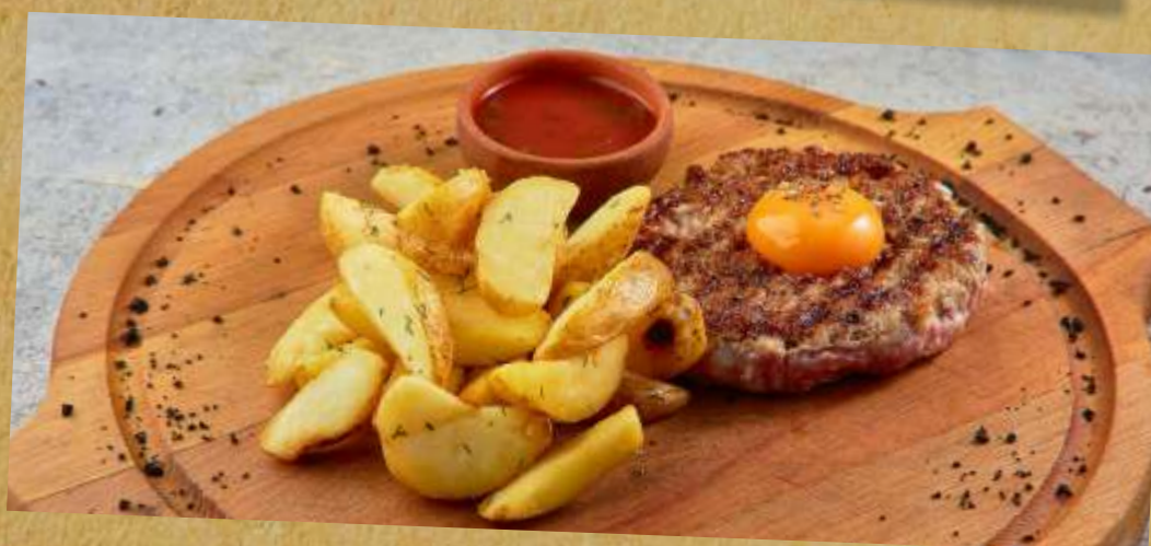
БИФШТЕКС ИЗ РУБЛЕННОЙ ГОВЯДИНЫ 518₽ MINCED BEEF STEAK 牛扒