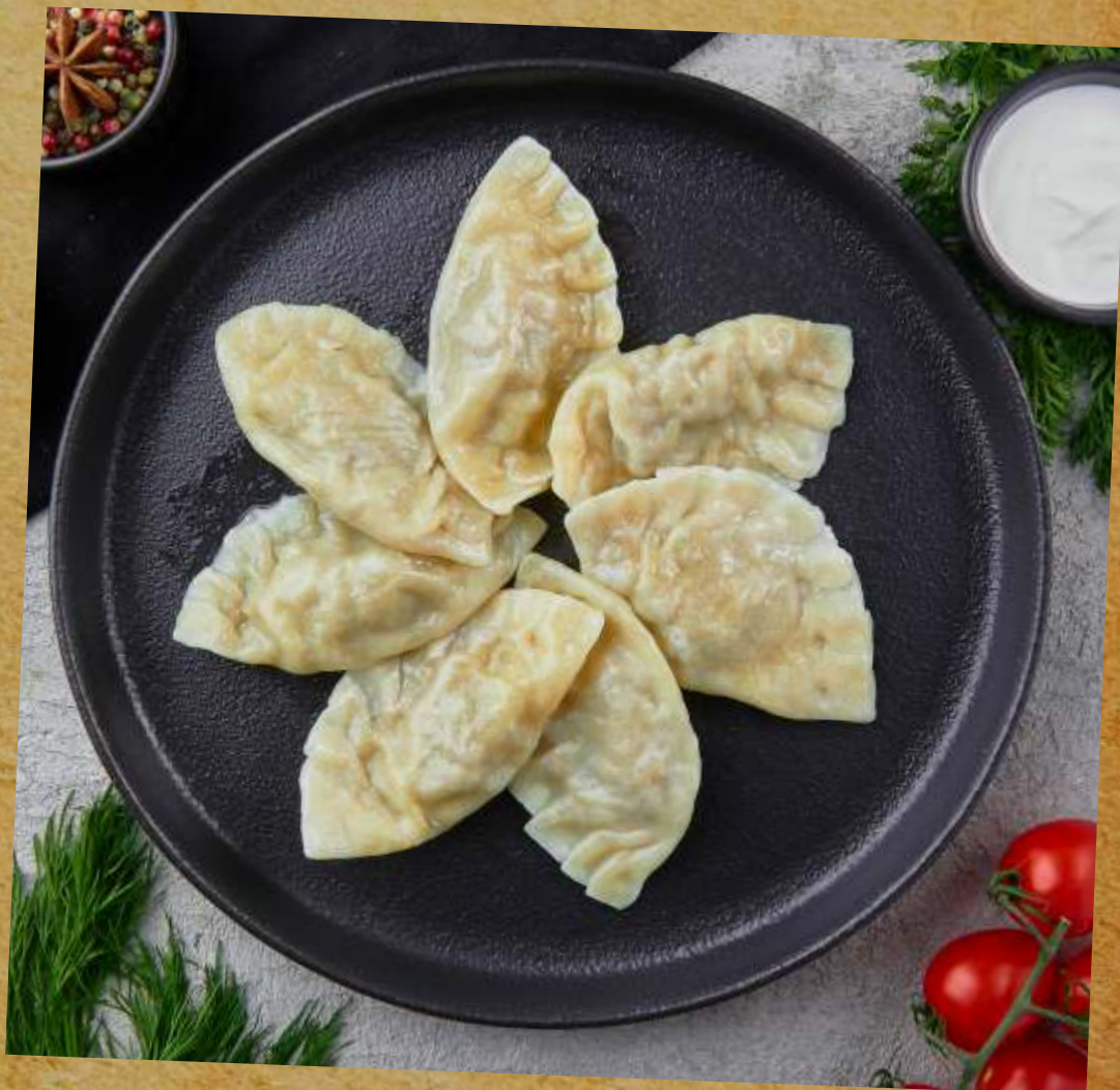
ВАРЕНИКИ С ГРИБАМИ И ПЕЧЕНЫМ КАРТОФЕЛЕМ DUMPLINGS WITH MUSHROOMS AND BAKED POTATOES 蘑菇和烤的土豆餃子