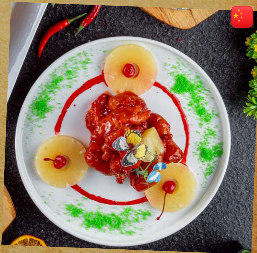
КРЕВЕТКИ В КИСЛО-СЛАДКОМ СОУСЕ SHRIMPS IN SWEET AND SOUR SAUCE 菠萝咕咾虾