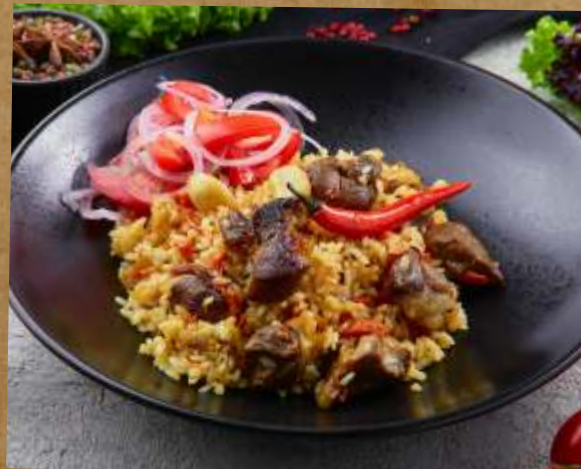
УЗБЕКСКИЙ ПЛОВ С ЯГНЕНКОМ UZBEK PILAF WITH LAMB MEAT 乌兹别克抓饭