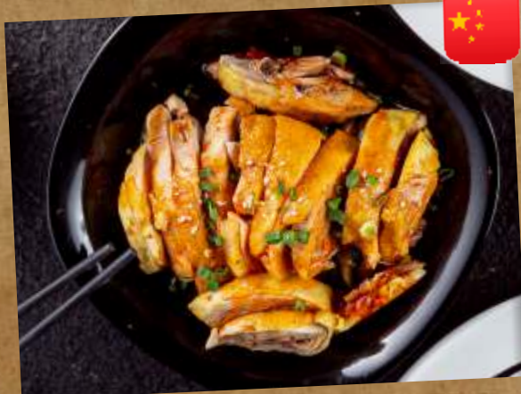
ОТВАРНОЙ ЦЫПЛЕНОК "КОУШУЙ" BOILED CHICKEN "KOSHUY" 川味口水鸡