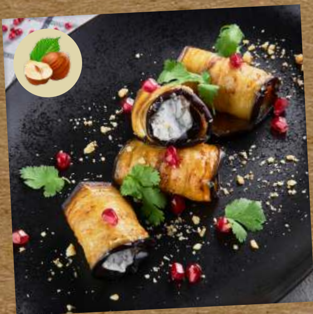
РУЛЕТКИ ИЗ БАКЛАЖАНОВ EGGPLANT ROLLS 茄子卷