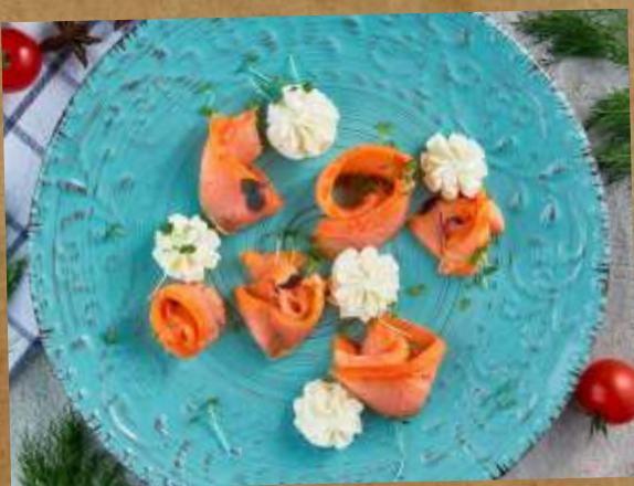
ФОРЕЛЬ СО СЛИВОЧНЫМ СЫРОМ TROUT WITH CREAM CHEESE 轻腌三文鱼