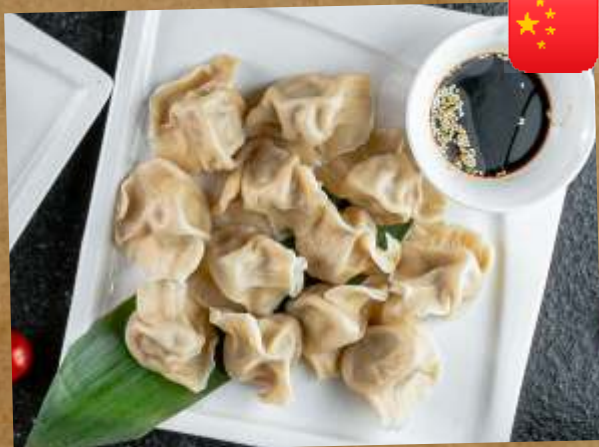
ВАРЕННЫЕ ПЕЛЬМЕНИ СО СВИНИНОЙ 328₽ BOILED DUMPLINGS WITH PORK 320ГР 白菜猪肉水饺