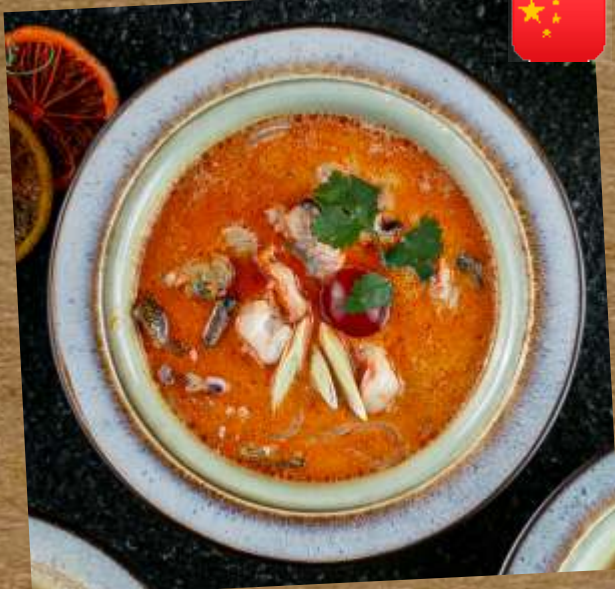
ОСТРЫЙ СУП "ТОМ ЯМ" SPICY SOUP "TOM YAM" 泰式东阳汤