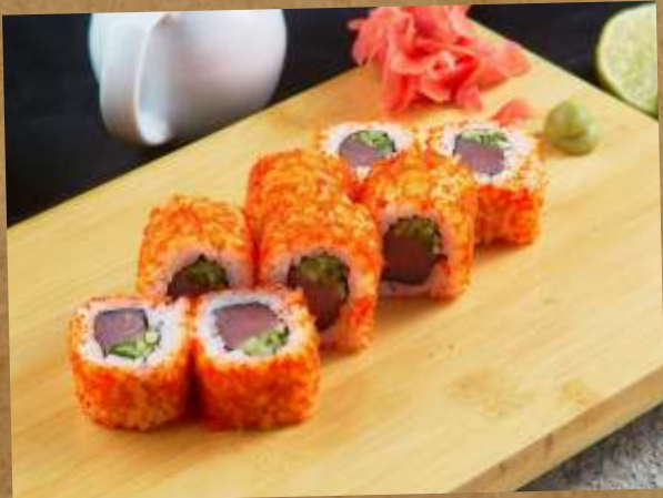
КАЛИФОРНИЯ CALIFORNIA ROLL 加州卷