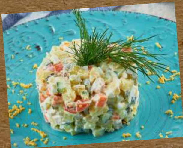
ОЛИВЬЕ С ИНДЕЙКОЙ SALAD WITH TURKEY MEAT 土耳其沙拉