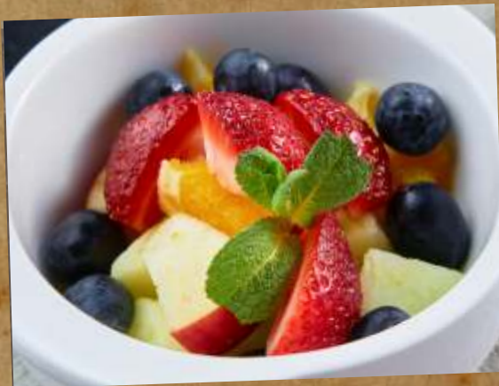
ФРУКТОВЫЙ САЛАТ FRUIT SALAD 水果沙拉