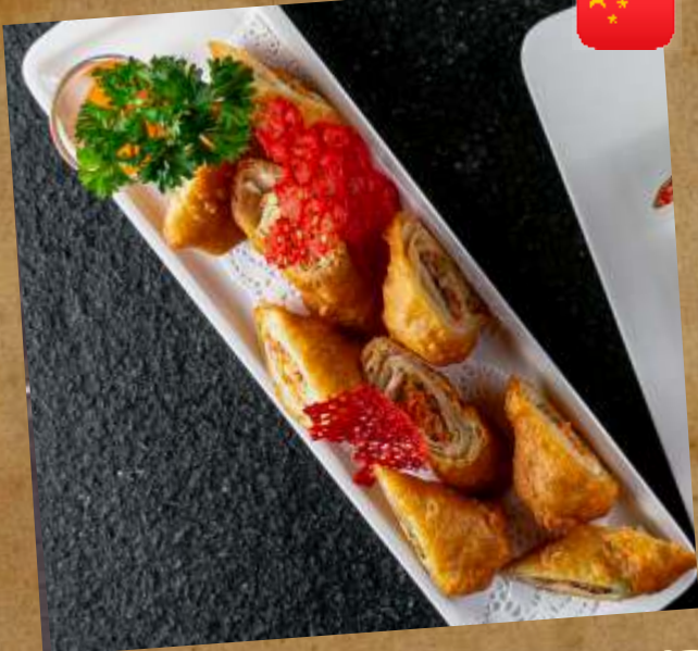
РУЛЕТКИ С НАЧИНКОЙ ИЗ УТКИ С ОВОЩАМИ DUCK ROULADES WITH VEGETABLES 越南鸭卷