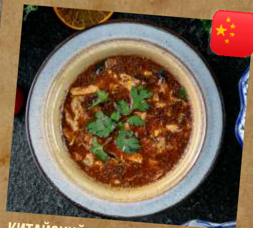
КИТАЙСКИЙ КИСЛО - ОСТРЫЙ СУП CHINESE SOUR SPICY SOUP 胶东酸辣汤