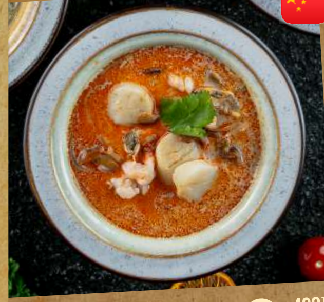
АЗИАТСКИЙ СУП С МОРЕПРОДУКТАМИ ASIAN SEAFOOD SOUP 亚洲海鲜汤