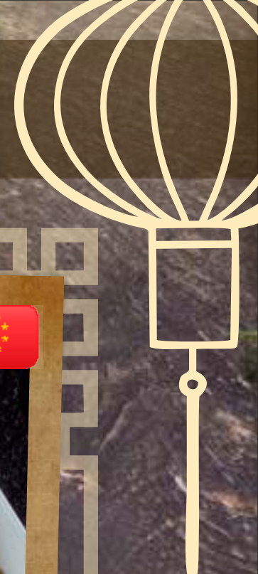
РИС И ЛАПША