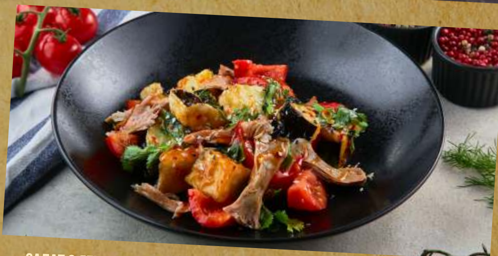
САЛАТ С ЯГНЕНКОМ И ОВОЩАМИ SALAD WITH LAMB AND VEGETABLES 羊肉和蔬菜沙拉