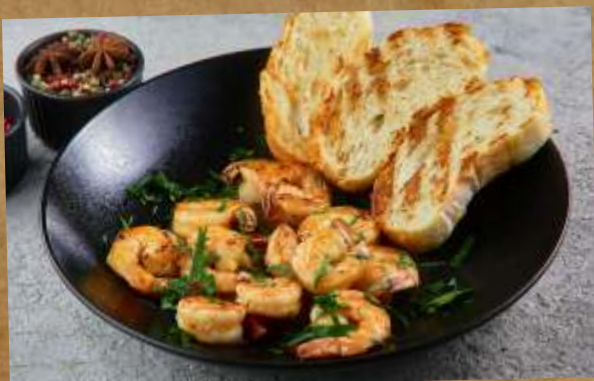
ТИГРОВЫЕ КРЕВЕТКИ В СЛИВОЧНОМ СОУСЕ TIGER PRAWNS IN A CREAM SAUCE 虎虾奶油酱