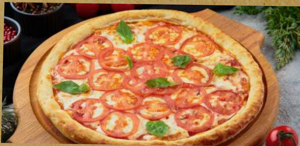
ПИЦЦА МАРГАРИТА PIZZA MARGARITA 玛格丽塔披萨