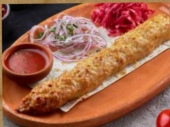
ЛЮЛЯ КЕБАБ ИЗ КУРЫ CHICKEN LYULYA KEBAB 鸡肉串