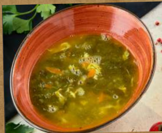
ЩАВЕЛЕВЫЙ СУП С ТЕЛЯТИНОЙ SORREL SOUP WITH VEAL 栗色汤小牛肉