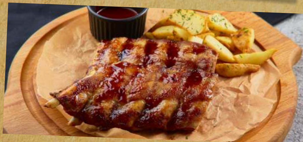
СВИНЫЕ РЕБРА В СОУСЕ BBQ SPARE RIBS IN A BBQ SAUCE 烧烤排骨