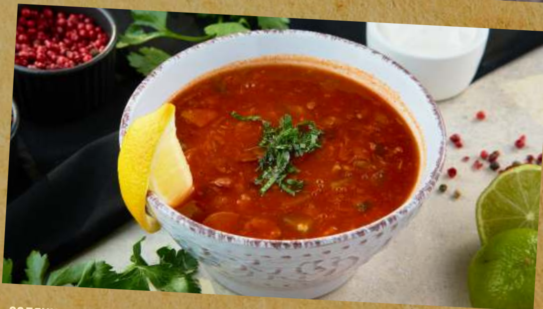
СОЛЯНКА «SOLYANKA» MEAT SOUP 肉类大杂烩