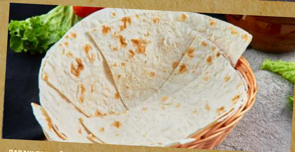
ЛАВАШ ТОНКИЙ THIN LAVASH 烤薄饼