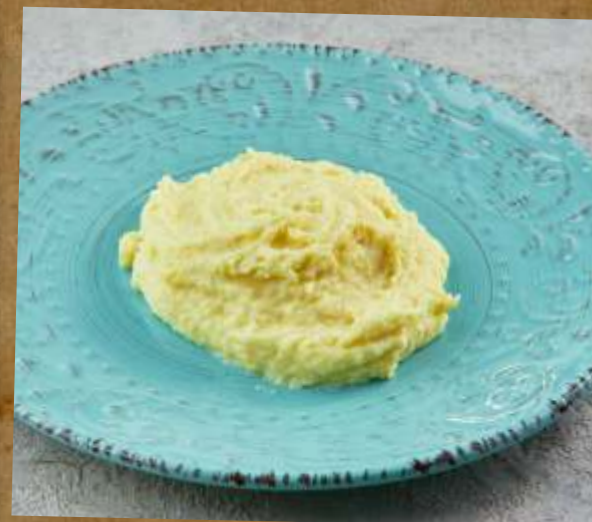
КАРТОФЕЛЬ ПЮРЕ / ОТВАРНОЙ MASHED POTATOES / BOILED POTATOES 土豆泥/煮土豆