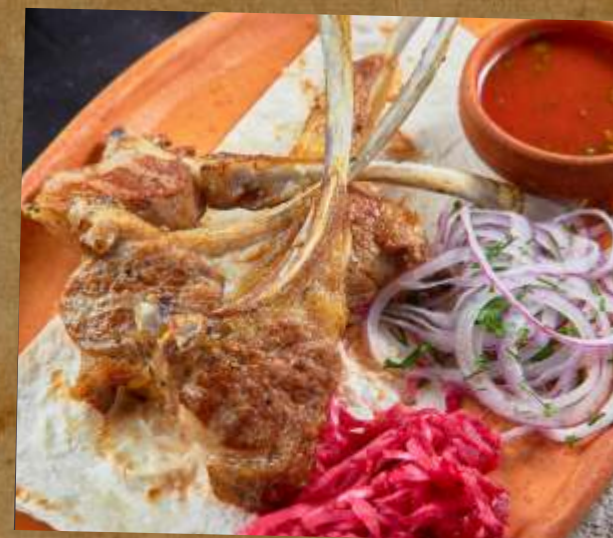
КОРЕЙКА ЯГНЕНКА LAMB LOIN 羊排烧烤