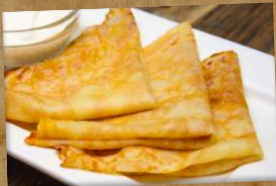
БЛИНЫ PANCAKES 薄煎饼