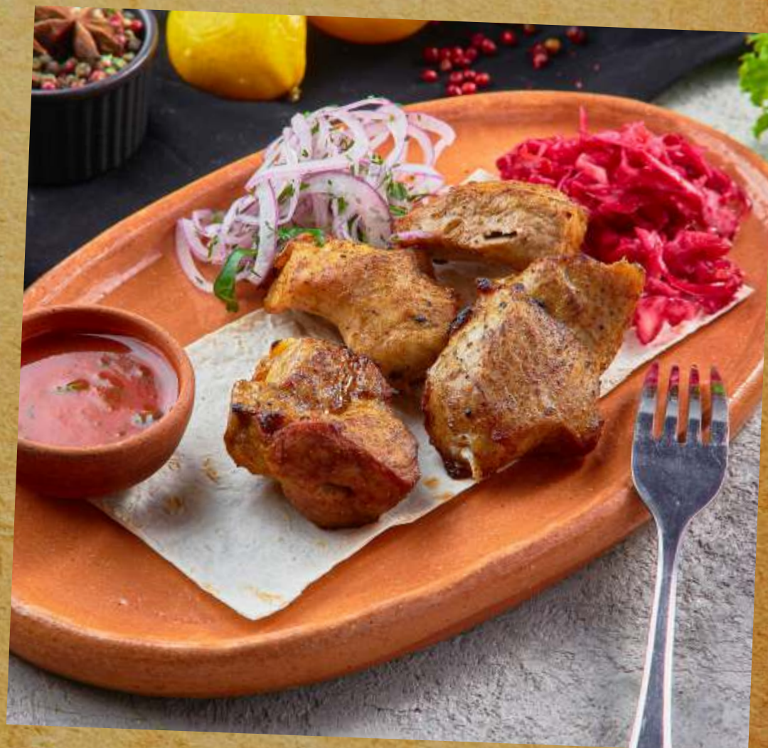
ШАШЛЫК ИЗ СВИНОЙ ШЕИ PORK NECK SHASHLYK 煎炸猪肉串