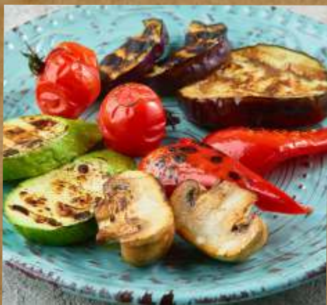
ОВОЩИ НА ГРИЛЕ GRILLED VEGETABLES 烤蔬菜