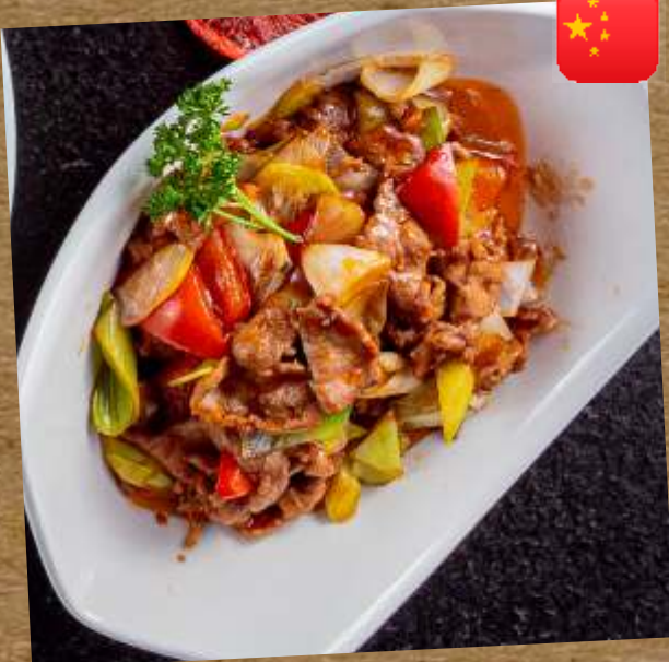
ЖАРЕНАЯ БАРАНИНА С ЛУКОМ В УСТРИЧНОМ СОУСЕ FRIED LAMB WITH ONION IN OYSTER SAUCE 葱爆羊肉