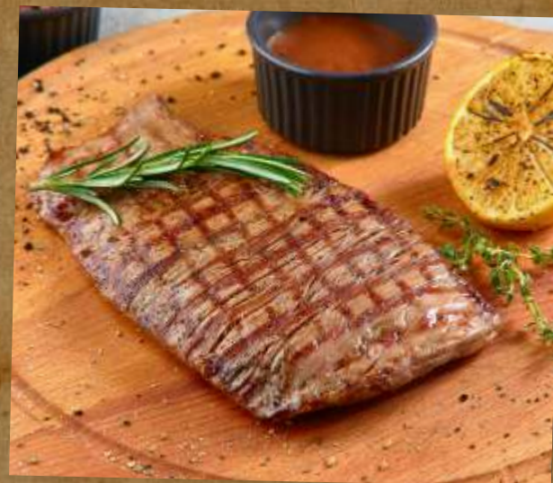
ФЛАНК FLANK STEAK 侧面牛排