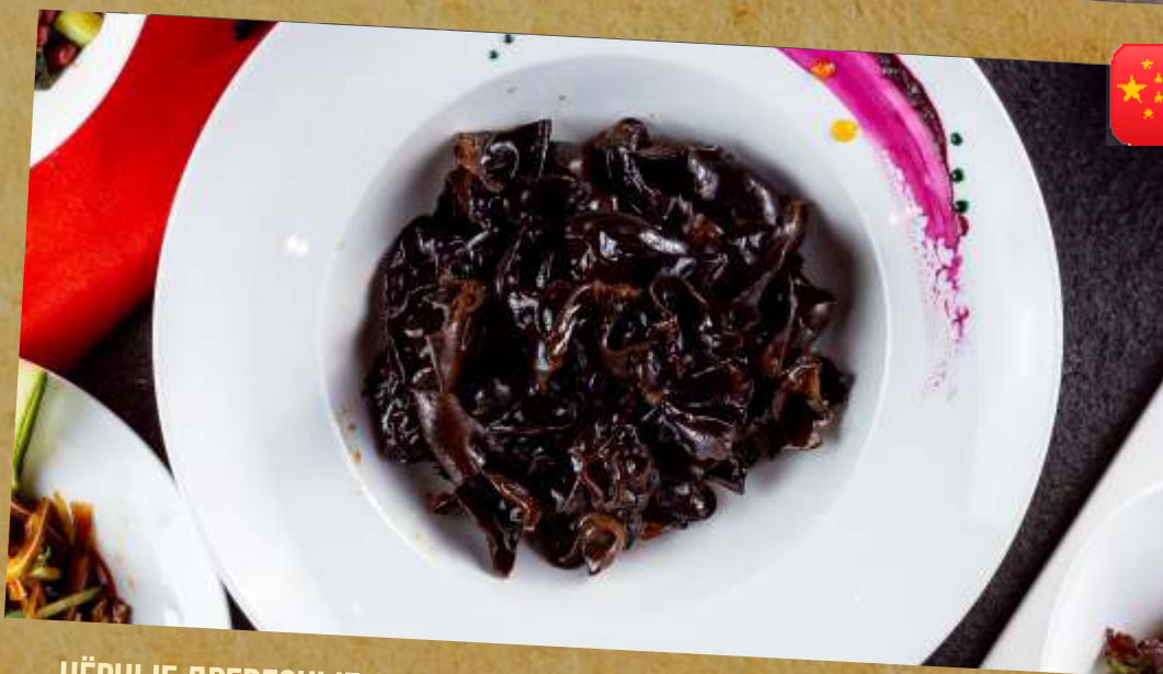
ЧЁРНЫЕ ДРЕВЕСНЫЕ ГРИБЫ С ЧЕСНОКОМ И КИНЗОЙ MUSHROOM SALAD WITH GARLIC AND CORIANDER 爽口秋耳