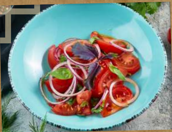
САЛАТ С АЗЕРБАЙДЖАНСКИМИ ТОМАТАМИ И БАЗИЛИКОМ SALAD WITH AZERBAIJANI TOMATOES AND BASIL 番茄和罗勒沙拉