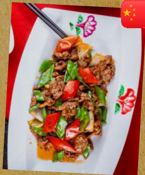
БАРАНИНА В СОУСЕ "ЧЁРНЫЙ ПЕРЕЦ" LAMB IN BLACK PEPPER SAUCE 黑椒羊肉