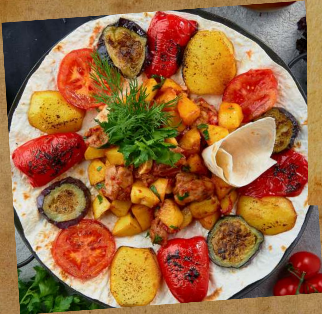
САДЖ ИЗ БАРАНИНЫ / САДЖ ИЗ КУРЫ «SADJ» WITH MUTTON / WITH CHICKEN 羊肉锅 / 炖鸡肉