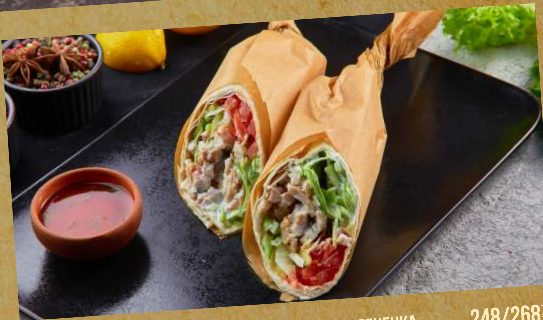
ШАВЕРМА ИЗ СОЧНОГО ЦЫПЛЕНКА / ШАВЕРМА ИЗ ЯГНЕНКА CHICKEN / LAMB DONNER 沙瓦玛鸡/沙威玛羊肉