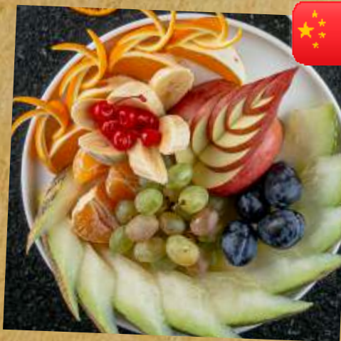
ФРУКТОВОЕ АССОРТИ ASSORTED FRUIT 什锦水果拼盘