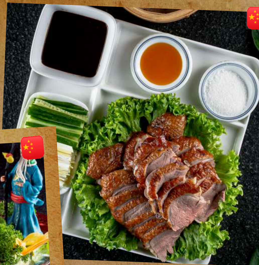
УТКА ПО-ПЕКИНСКИ PEKING DUCK 北京烤鸭