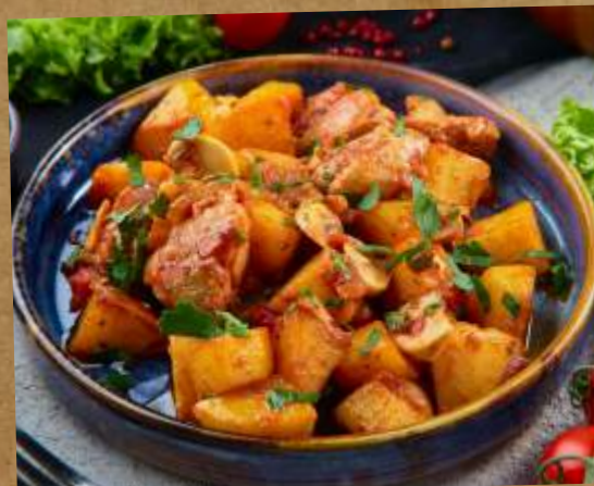
ЖАРКОЕ ИЗ БАРАНИНЫ / ИЗ КУРЫ С ГРИБАМИ MUTTON STEW / CHICKEN WITH MUSHROOMS STEW 燻炙