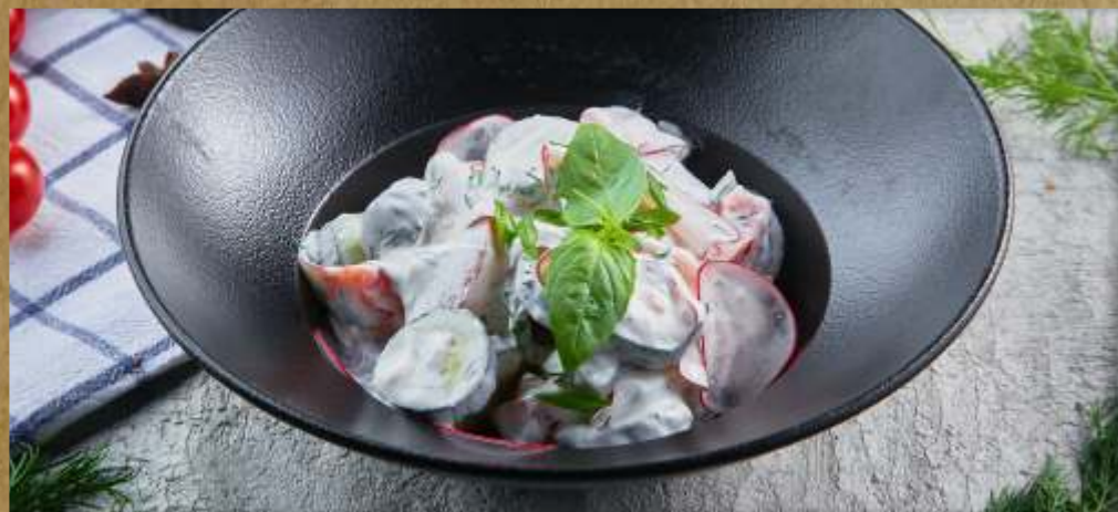
ОВОЩНОЙ САЛАТ СО СМЕТАНОЙ VEGETABLE SALAD WITH SOUR-CREAM 蔬菜加酸奶油沙拉