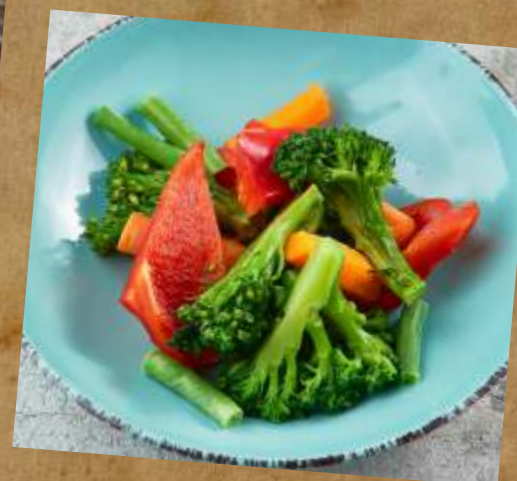
ОВОЩИ НА ПАРУ STEAMED VEGETABLES 清蒸蔬菜