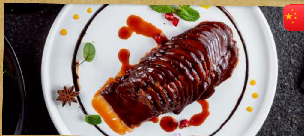
ОСТРАЯ ГОВЯДИНА В УСТРИЧНОМ СОУСЕ SPICY BEEF IN OYSTER SAUCE 孔府酱牛肉